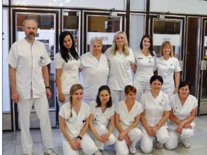
Těšíme se do nového