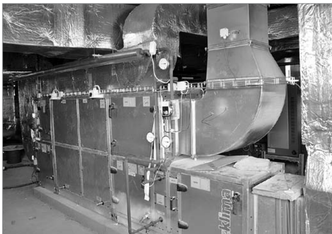
Strojovna vzduchotechniky je v šestém nadzemním podlaží, kde je situováno technické zázemí (strojovna vzduchotechniky a zdroj chladu)