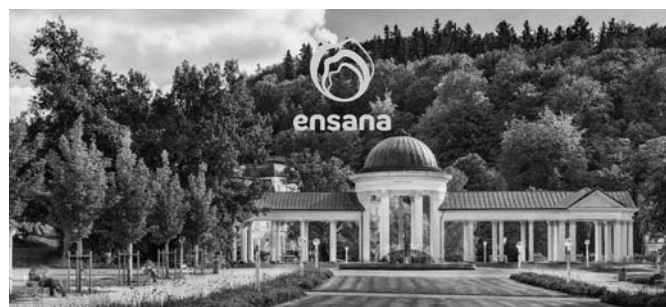
Hvězda / Centrální Lázně Ensana Health Spa Hotels

V letošním roce mohou využít zvýhodněný rekondiční pobyt s procedurami zdarma v Mariánských Lázních. „Na pobyt je možné do 30. června 2021 využít státní voucher v hodnotě 4 000 Kč a zvýhodněná nabídka se vztahuje i na rodinné příslušníky doprovázející objednávacího zdravotníka,“ informovala Kurtinová. Rekondiční pobyt zahrnuje sedm nocí ve 4* hotelu superior s plnou penzí a s osmi léčebnými procedurami. Jedná se o originální mariánskolázeňské procedury s využitím přírodních léčivých zdrojů (2x vodní uhličitá koupel, 2x suchá uhličitá koupel, 2x částečná masáž a 2x inhalace). Nabídka je platná až do konce roku.